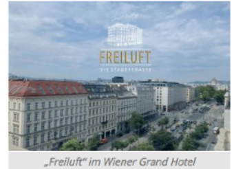
„Freiluft“ im Wiener Grand Hotel

Öffnungszeiten: Montag bis Samstag von 16 Uhr bis 23 Uhr Grand Hotel Wien, Kärtner Ring 9, 1010 Wien Reservierungen: reservierung@freiluft.bar