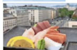
Sushi & Drinks am Hotel-Dach.

Weltklasse-Cocktails von wechselnden Bartendern sollen ebenso auf der Karte stehen wie Haubenküche-Sushi aus dem Unkai. California Maki gibt es um 16 Euro, Nigiri um 18 Euro.