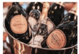
Feinster Champagner der Marke Laurent Perrier im Angebot.