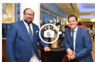
Eröffnung / Freiluft Grand-Rooftop im Grand Hotel Wien